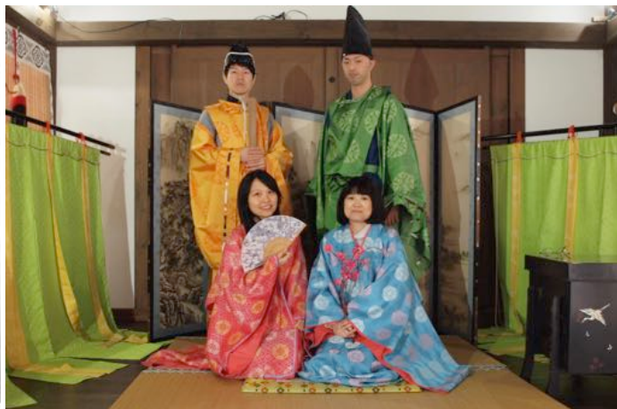
映画村つばいと藤原の郷という

だと感じています。私は、中学時代に「ぼくを助けてくださったイエスのために生きる」と決めました。その時のイエスさまへの情熱の炎は、その後変わることなく未だに心の中で燃えています。この情熱こそが、これからの時代必要となると考えています。下の国土交通省のグラフが示すように、人口減少時代という日本の歴史上初めての時代を私たちは経験しています。それによって日常生活や、生き方など全てが「今まで通り」とはいかなくなってくることでしょう。日本の人口は800年から2004年までは増加傾向にありましたが、これからは急減します。ビジネスも教会も、人口増加に頼れなくなり、本物や本質的なものだけが生き残る時代へとなっていくと考えています。