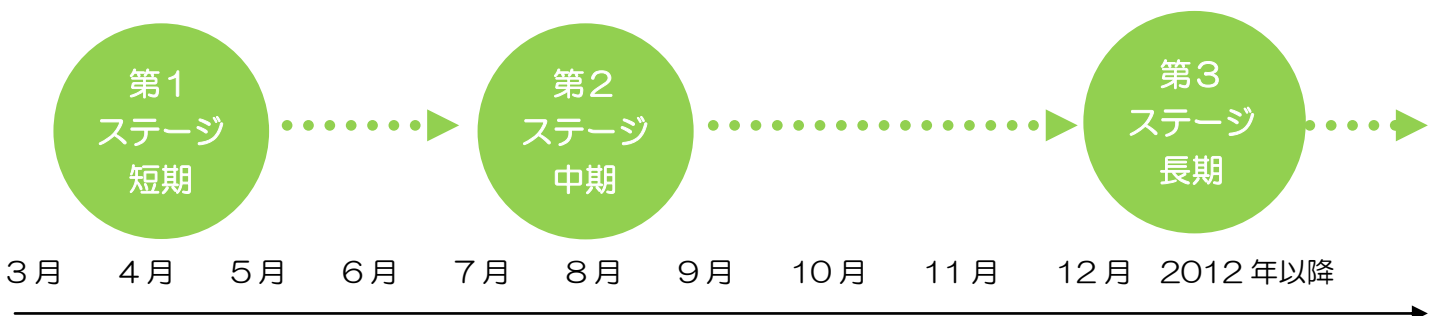
福島県でのFVIの震災支援計画

日本全国からの支援に加え、欧米諸国を始めアフリカ・アジアからも多くの方々が日本を訪れ、祈りと具体的な支援をしてくださっていることも感謝です。