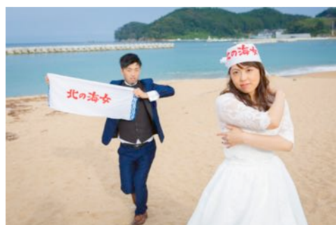
左（感動的な挙式！涙、涙。。） 右上（岩手の家族 OLD の愉快的余興） 右下（岩手の美しい海でパシャリ！）